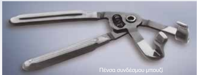
Πένσα συνδέσμου μπουζί