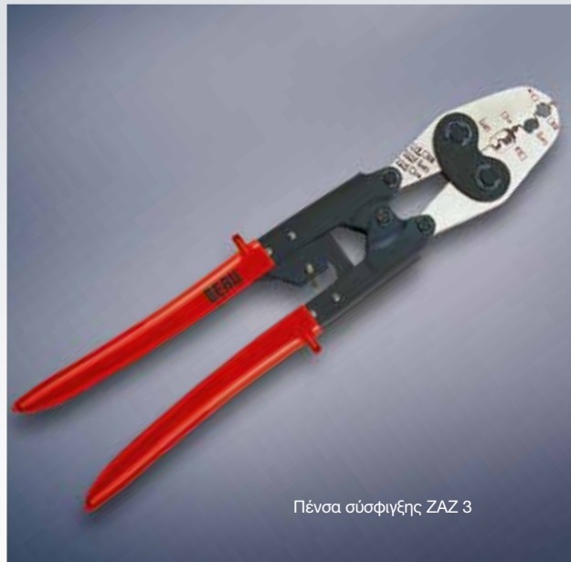
Πένσα σύσφιξης ZAZ 3

Για την ασφαλή εγκατάσταση χιτώνιων επαφής στα καλώδια ανάφλεξης