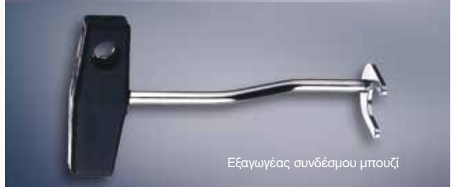
Εξαγωγέας συνδέσμου μπουζί